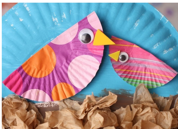
Ptaszki z wykorzystaniem papierowych foremek do muffinków i papierowego talerza.